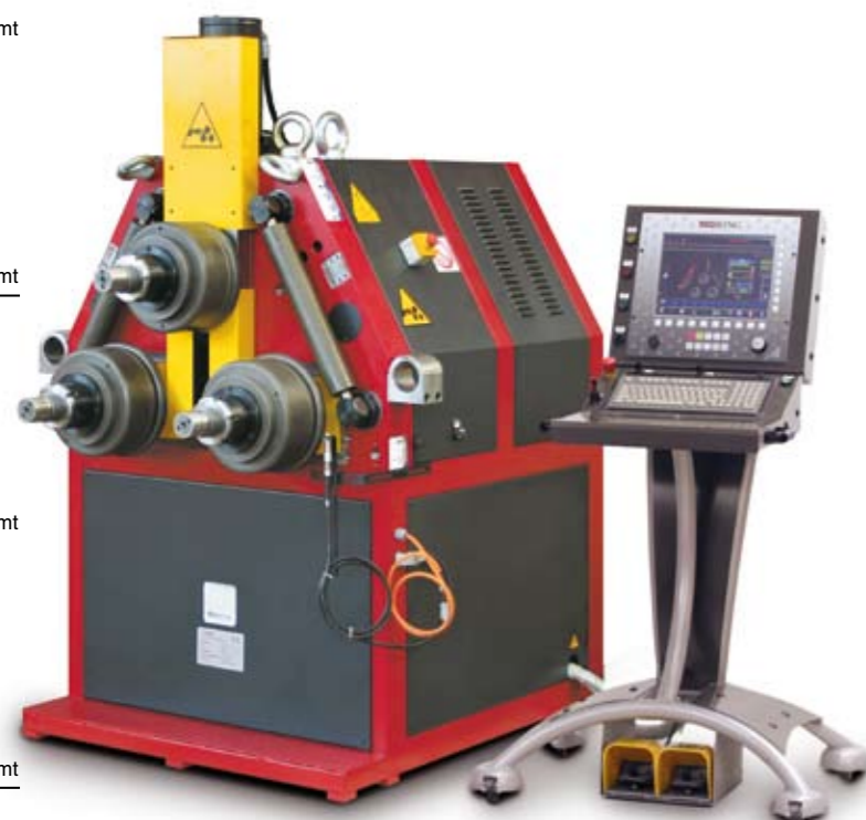
DELTA 80 equipaggiata con CNC-i DELTA 80 equipped with CNC-i

The machine is equipped with an interpolated numerical control able to perfectly manage the developments of the bent parts, controlling the value of the strains in relation to the obtained radius and to the used material. The predetermination of the bending radius is another strength of the new CNC-i, which applied to the machine allows the bending with variables radii at the highest accuracy and repeatability. This interpolated numerical control, together with the powerful Wintau interface, designed to simplify and speed up the programming, represents the maximum technology expression never applied to the bending.