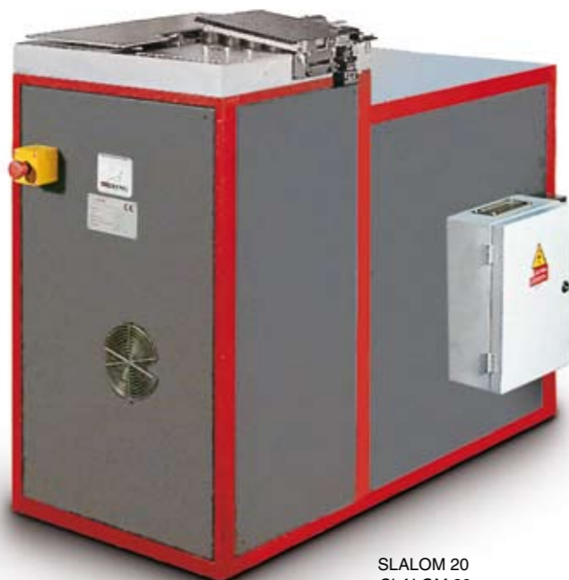
SLALOM 20 SLALOM 20